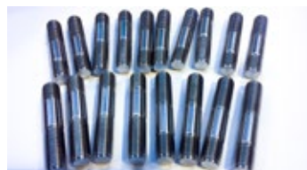
Screw DIN939 M16x70, Titanium Gr5