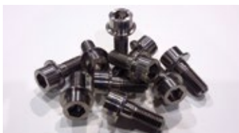
Socket screw M16x2, Titanium Gr2