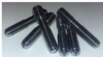
Screw UNC3/4 and UNC3/4-UNC7/8, EN 1.4057