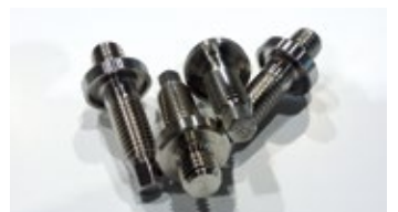
Adjustment screw M12, EN 1.4410